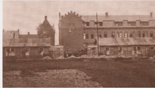
Achteraanzicht (vanuit de huidige Zijstraat) van Het Heilig Herte.

De Grauwzusters kopen een stuk grond aan de Stationsdreef.