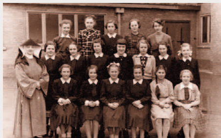
1 ste Latijn 1950-1951